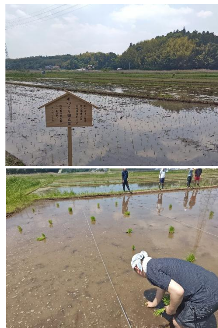
▲ 5 月 16 日に行われた田植えの様子

その他、玉川高島屋 S.C.の SDGs への取り組みについてはこちらから https://www.takashimaya.co.jp/tamagawa/sc/sdgs/