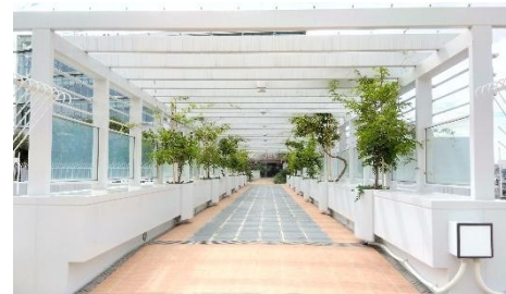
▲本館屋上ブリッジ

本館屋上ブリッジおよび西館駐車場屋上には、歩行・車両通行が可能な敷設型太陽光パネル「路面ソーラー」を導入しました。年間発電量は約 24 千 kWh で、一般家庭約 6 軒分に相当します。発電した電気は、館内で使用しています。お客様の動線上に設置し、発電を“見える化”することで、環境配慮を日常の風景の中で感じていただける取り組みです。