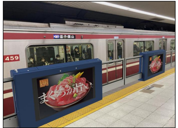
ホームドア内蔵型デジタルサイネージ