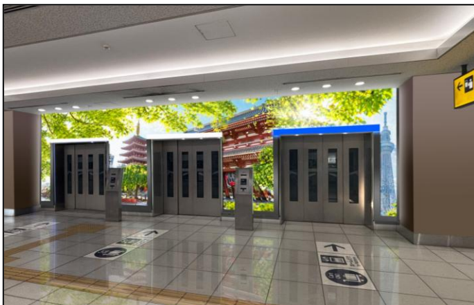
2階エレベーター部（改札内） デジタルサイネージ