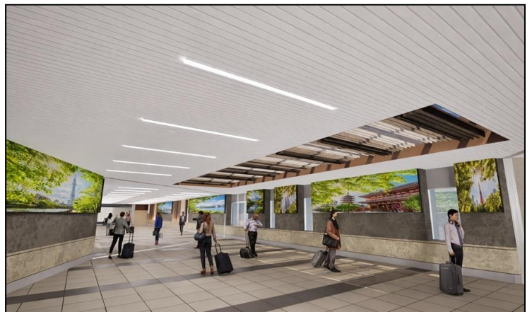
2階改札内連絡通路デジタルサイネージ