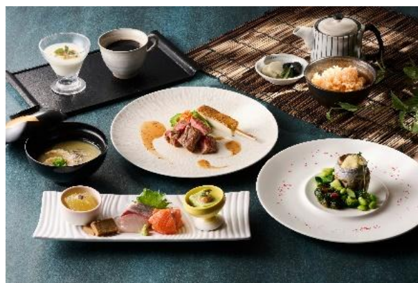
宿泊プラン イメージ

本プランでは、昨年ご好評をいただいた「箱根夕涼みプラン」から、より日本の夏文化を感じる滞在をお楽しみいただける内容となり皆様をお迎えます。涼やかな館内では色浴衣をまとい、箱根の自然に囲まれた散策体験を。ダイナーでは箱根外輪山を望むレストランで、季節の食材や地元の恵みを生かしたコース料理をお楽しみいただきます。食後には線香花火のやさしい灯りで夜のひとときを彩り、お部屋ではラムネと小田原のフルーツゼリーで涼を感じるひとときを演出。朝は旬の味わいを取り入れた和洋ブッフェが一日の始まりを豊かに調えます。カップルやご家族はもちろん、誰もが思い思いに夏の情景を楽しむ、心地よいご滞在を。