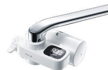
ウォーターサーバー CWMF-200