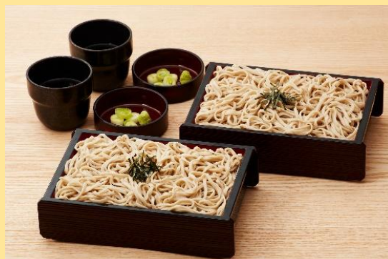
北海道そば食べ放題 1,780円(税込1,958円)