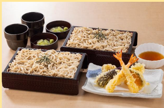
北海道そば食べ放題天ぷらセット 2,380円(税込2,618円) ※食べ放題対象は北海道そばのみです。

■実施日：2026年6月12日(金)、7月10日(金)、8月21日(金) 3日間限定