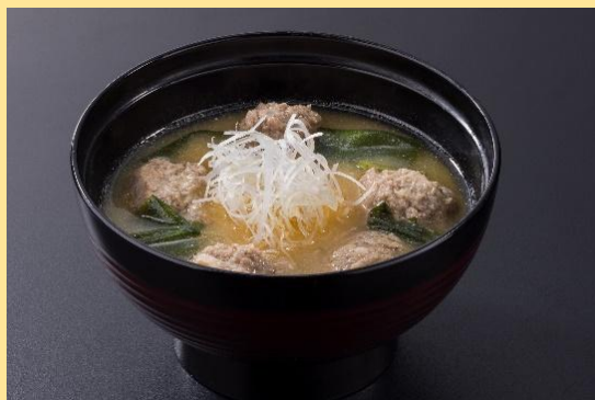
旨いわし汁 340円(税込374円)