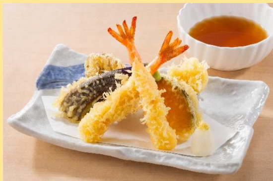
追加天ぷら 600円(税込660円) ※食べ放題をご注文の方のみご注文いただけます。