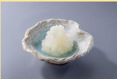
大根おろし 150円(税込165円)