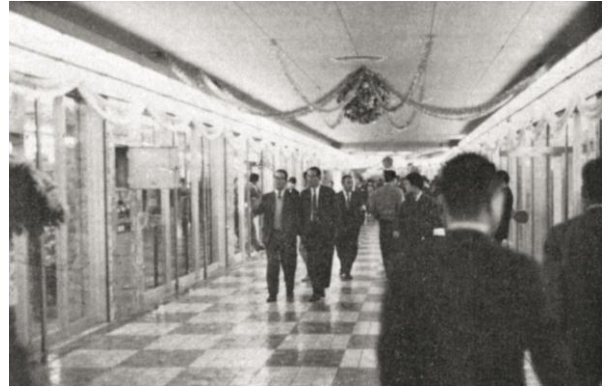
ウメダ地下センター (現「ホワイトティうめだ」)

その後、経済発展の加速とともに、民間・サービス需要に対応。商業施設(店舗)・ゴルフ場クラブハウスをはじめ、特に、レジャーブームや東京五輪開催を契機とした宿泊施設の需要増大にも積極的に対応し、ボウリングブーム・日本万博などの取り組みをすすめ、大きく業容を拡大していきました。