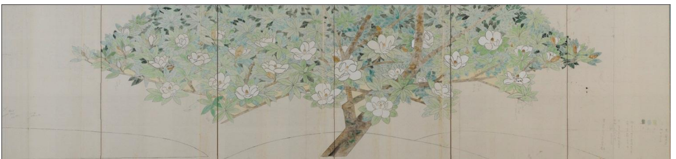
東京・歌舞伎座緞帳「泰山木」の配色図 1961（昭和36）年頃