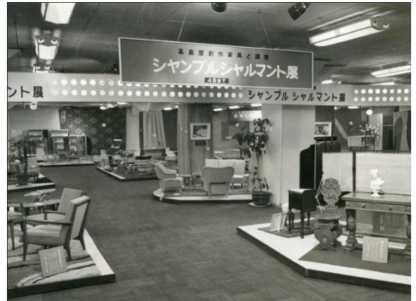
第1回シャンブル・シャルマント展 1956（昭和31）年

戦前戦後を通じ家具・室内装飾の分野で数々の仕事を行うことで、技術を培い、1956（昭和31）年6月には、「高島屋創作家具と調度 シャンブル・シャルマント展」を各店で開催。シャンブル・シャルマントとはフランス語で「魅力ある部屋」という意味です。戦後、新しい生活のあり方が模索されていた時期に、いち早く住まい方の提案をした催事で、設計・装飾部門のデザイナーたちによる社内公募を行い、高島屋工作所（当時）などの協力工場で作成が重ねられ、製品化・販売され、人気を博しました。