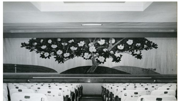
東京・歌舞伎座緞帳「泰山木」（奥村土牛原画）

高島屋は美術染織品制作で培った経験を活かし、著名な画家の原画によるものを中心に明治時代末期より数々のすぐれた美術緞帳を調製しました。それは戦後にも受け継がれ、大阪・帝国座、東京の歌舞伎座や大阪歌舞伎座（のちに新歌舞伎座）や、大阪・毎日ホールなどの緞帳を次々に手がけました。装飾・美術などまさに高島屋の総力で表現する仕事といえる緞帳の「調製」について紹介いたします。