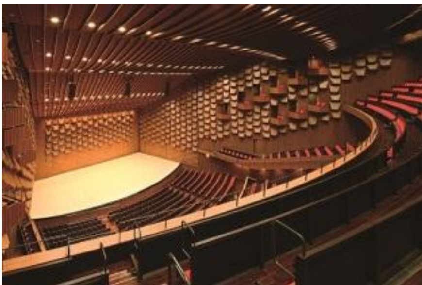
フェスティバルホール 2013 (平成 25) 年