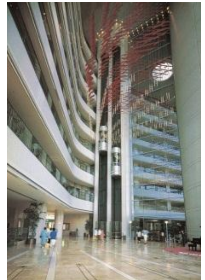
大阪ヒルトンプラザホール 1996 (平成 8) 年

2013 (平成 25) 年には、震災後の東北地区における事業基盤の再構築のため、仙台市に子会社「高島屋スペースクリエイツ東北株式会社」を立ち上げ、本格化する東北の復興事業にも積極的に携わっています。