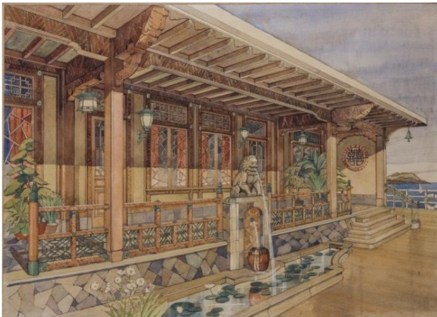
秩父丸1等ベランダ透視図 昭和時代初期 (三菱重工業株式会社横浜製作所蔵)

昨年、高島屋の装飾事業は135周年を迎えました。本展では、これまで携わった公共建築物、船舶、鉄道の内装や家具、劇場の緞帳などの資料や写真パネルなど約160点を展示。高島屋の装飾事業の軌跡を振り返ります。