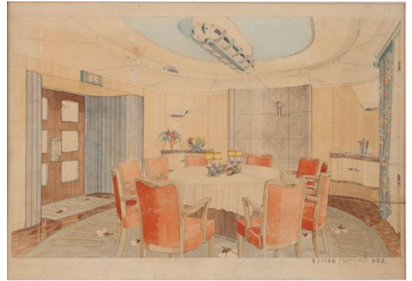
樫原丸プライベートサロン透視図第2案 昭和10年代前半

明治時代後期より、日本の造船の発展とともに、貨客船や連絡線、大型客船などの内装や家具などを手がけてきました。船舶内装のはじまりは、1890（明治32）年に受注を受けた鉄道連絡船豊浦丸」でした。昭和時代初期までは自国の船舶であっても内装設計は欧米の会社を中心でしたが、国内でも船舶インテリアの設計施工をまかなえるようになり、高島屋も「秩父丸」（1930年竣工）などを手がけるのをはじめとし、その中に進出していきます。「八幡丸」（1940年竣工、1942年に空母に改造）、「樫原丸」、「出雲丸」（いずれも1939年起工、竣工前の1940年に空母に改造）など、本格的な船舶の透視図が残されています。