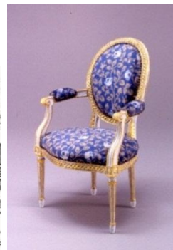
↑ フランス・ルイ16世様式の肘掛け椅子のミニチュア(縮尺1/5)