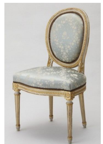
↑ 迎賓館赤坂離宮「花鳥の間」と同型の椅子