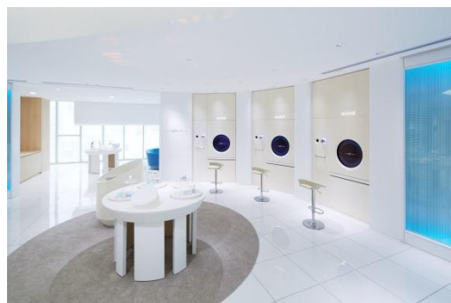
ビルトインタイプ

台 数：4台 (ラゲジタイプ1台、ビルトインタイプ3台) 所 要 時 間：15～20分 料 金：無料 ホームページ：URL: http://acuvue.jp/eyedefinestudio/