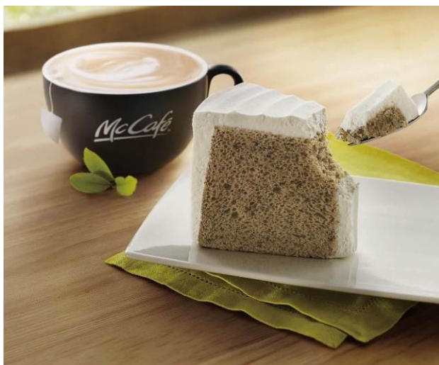
【「Barista's Cake Set」組み合わせ一例】