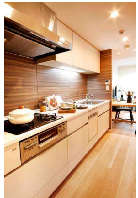
※写真は全て Renoα の施行例