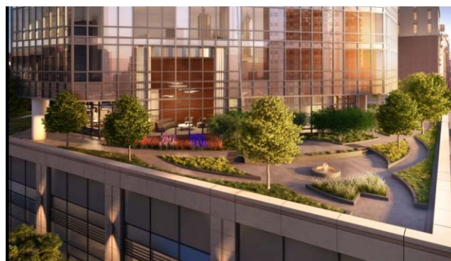
2階のガーデンテラスイメージパース