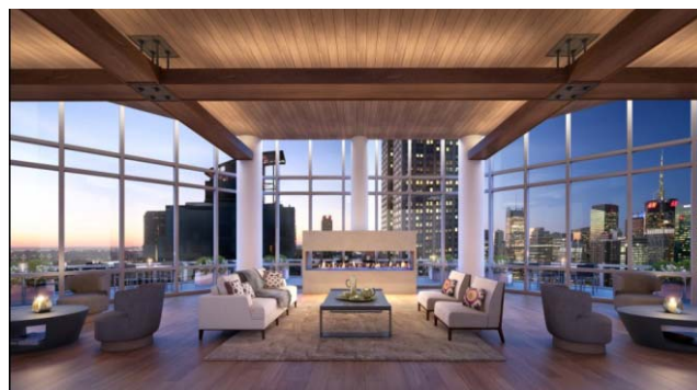
最上階ラウンジイメージパース