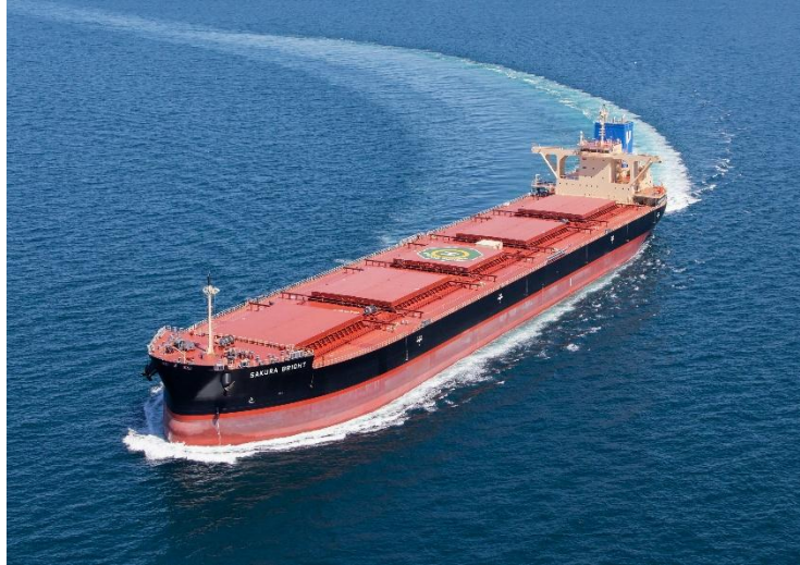
係船管理共同実証を行う SAKURA BRIGHT