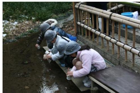
本年2月 ホタルの幼虫をせせらぎに放流する小学生の皆さんの様子

取材に関するお問い合わせ 〒112-8664 東京都文京区関口2-10-8 藤田観光株式会社 広報部 小宮山 誠・真田 誠二・北原 靖子 TEL:03-5981-7703/FAX:03-5981-7735