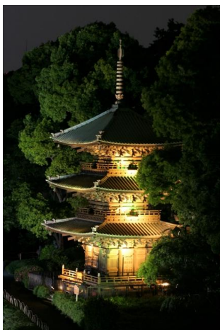
庭園の三重塔では、ホタル、太陽、月の光をイメージしたライトアップを行います(19:00～22:00 15分毎)