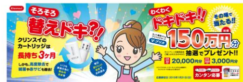
「そろそろ替えドキ?! ワクワドキドキ!!」キャンペーンPOP

本キャンペーンでは、対象商品購入者の中から抽選で330名 に、ネット専用Visaプリペイドカード「V-プリカ」を総額150万円分 プレゼントいたします。商品についてのシリアルナンバーを使ってス マートフォンやパソコンから応募する「その場で当たる」キャンペー ンで、お客様のカートリッジ交換への意識を喚起する狙いです。