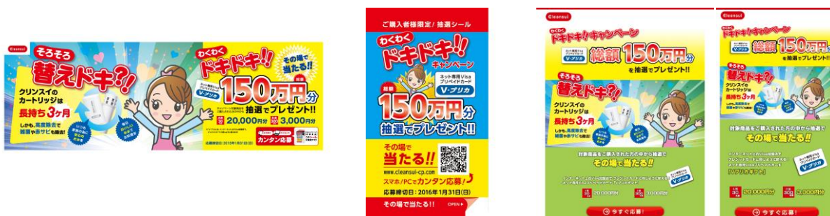
「そろそろ替えドキ?! ワクワドキドキ!!」 キャンペーンPOP(左)と、キャンペーンシール(中)、キャンペーンサイト(右)