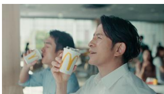
岡田さん「ここ、オアシスかよ！」