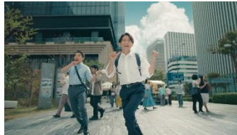
♪のみにいこー アイスのコーヒー