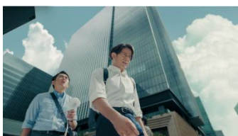
後輩「やばい暑さっすね」