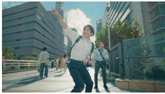
♪のみにいこー マックでコーヒー