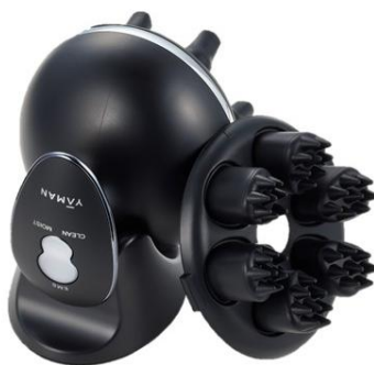
ヴェーダニードルスパ デュアル

「美しくを、変えていく。」をスローガンに掲げ、技術の力でグローバルに美の進化に挑み続ける 5年連続美顔器シェアNO.1* 1 のヤーマン株式会社（所在地：東京都江東区、代表取締役社長：山崎貴三代）は、長年の美容研究から生まれた、最先端技術に基づくトータルビューティーケアライン「YA-MAN TOKYO JAPAN プロ ライン」より、『ヴェーダニードルスパ デュアル』と『ヴェーダヘアボリュームマー プロ PLUS』を、2026年5月6日(水・祝)より順次発売いたします。