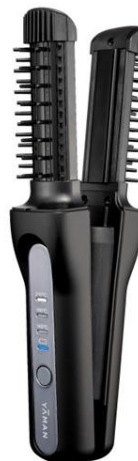
ヴェーダヘアボリュームマー プロ PLUS