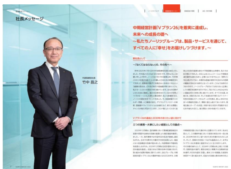
【トップメッセージ】

ノーリツグループは、ミッションである「新しい幸せを、わかすこと。」の実現をイメージして、アウトカムに「豊かな暮らしと地球への貢献を両立できる社会」を定めるとともにマテリアリティ（重要課題）の再設定を行い、中期経営計画「Vプラン26」を推進しています。