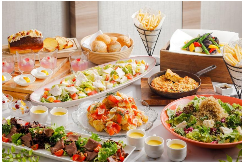
「Pick & Enjoy Lunch」イメージ