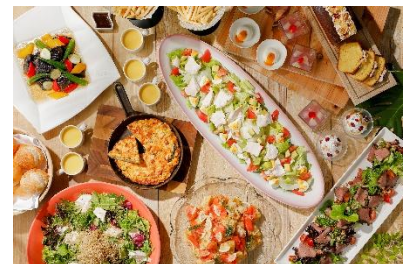
「Pick & Enjoy Lunch」buffet イメージ