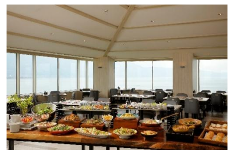
Grill & Dining G イメージ

※上記料金は消費税・サービス料込みの料金です。 ※記載のメニュー内容は変更になる場合がございます。