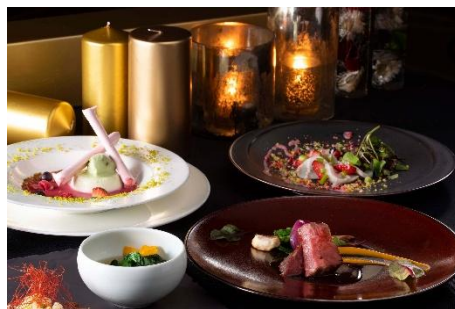
ディナー イメージ

レストラン シンフォニー(26階)では、二方向に広がる美しい眺望とスタイリッシュなインテリア空間が広がり、リラックスした雰囲気の中でお楽しみいただけます。オープンキッチンでは、シェフの調理やキッチンの活気溢れる雰囲気を間近に感じることができ、レストランシェフ自ら東北各地へ出向き、自らの目で確かめた旬の恵みを最大限に引き立てたディナーコースをお召し上がりいただけます。