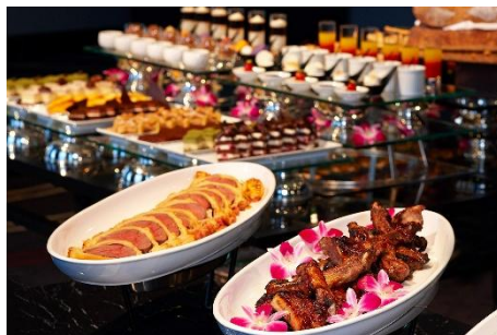
カクテルタイム イメージ