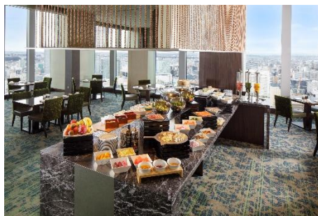
朝食ブッフェ台 イメージ

より美味しく、より効果的に栄養を摂取できるイトウェルメニューもご用意しており、ふわふわのオムレツや、牛たんシチューなど、多彩な味わいをお楽しみいただけます。