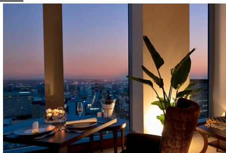
クラブラウンジ イメージ