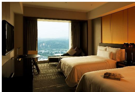
スーペリアルーム イメージ

また、全ての客室には、ウェスティンオリジナルの「ヘブンリーベッド」が設置され、お客様に快適な“雲の上の寝心地”をお約束いたします。