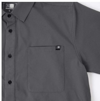
ピスネームつき チェストポケット