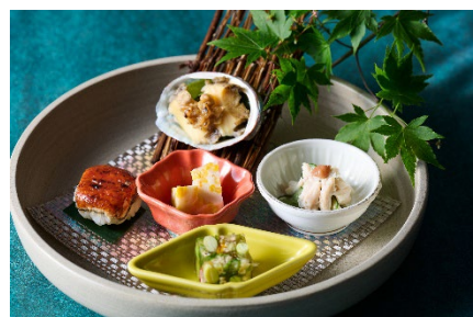
季節を彩る前菜イメージ