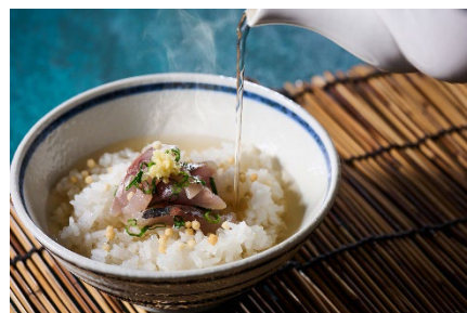
鰯まご茶漬けイメージ