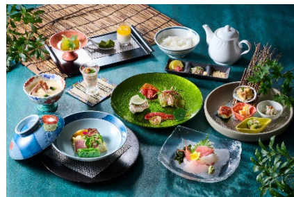
和洋コース「極-KIWAMI-」イメージ