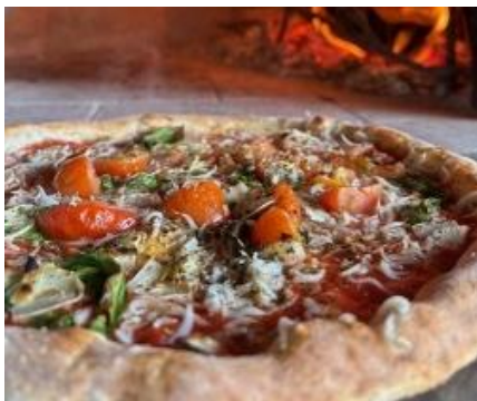
【Daddy's Pizza /SHIRASU GARIC ピザ】