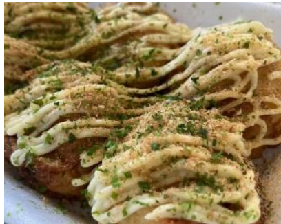
【Pulu pulu pulpo! /たこ焼き】