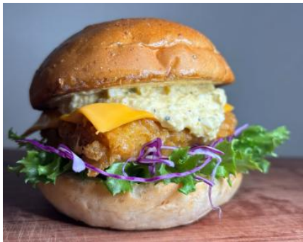
【Rokks/フィッシュバーガー】