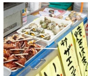
【三浦海岸トラック市】