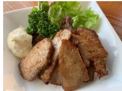
【cafe 134 /三崎まぐろの特選竜田揚げ】