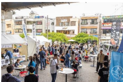
【昨年のビールまつりの様子】