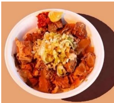
【提灯東京/バラナン丼】