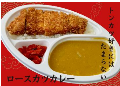
【だるま食堂/ロースカツカレー】