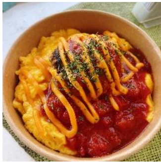
【丘の上のお弁当屋さん/ オムバーグ Bowl】