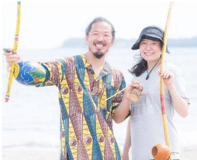
FILHOS DE ANGOLA