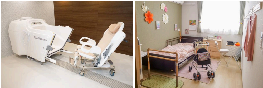
▲介護度に応じた浴槽(左)と居室イメージ(右)