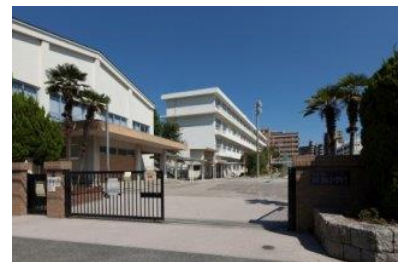
市立祇園小学校 徒歩2分(約150m)