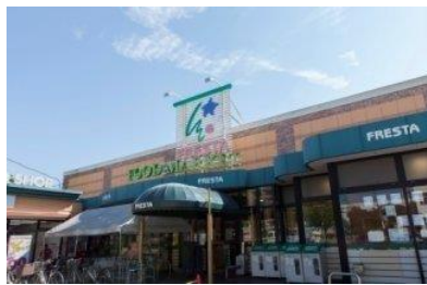
フレスタ 祇園店 徒歩5分(約390m)