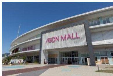
イオンモール広島祇園 徒歩2分(約100m)