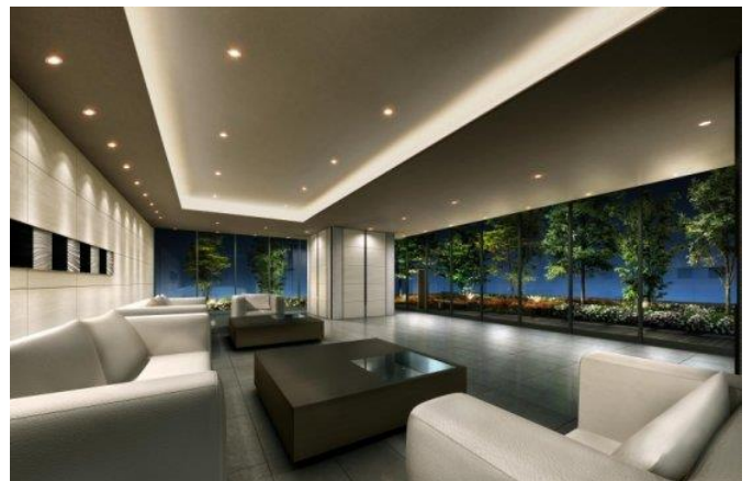
入居者や来客者に上質のおもてなしを提供するラウンジ