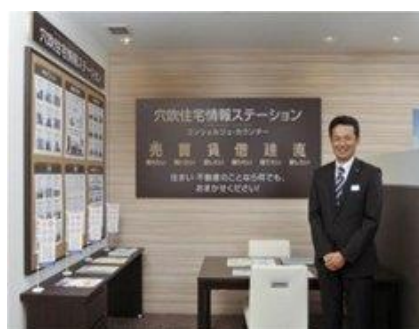
「住宅情報ステーション」 コンシェルジュ・カウンター