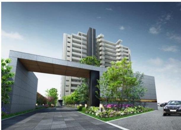
奥行きのある「アプローチプロムナード」には、四季折々の植栽を配置

邸宅の門構えを思わせる重厚感あるゲートと奥行きのある「アプローチプロムナード」が入居者をお出迎え。スツールを設け四季折々の季節を感じられる植栽を配して、ラウンジへと続く空間を構成しました。時を刻む自然とお住まいになる方の語らいの場を演出しています。