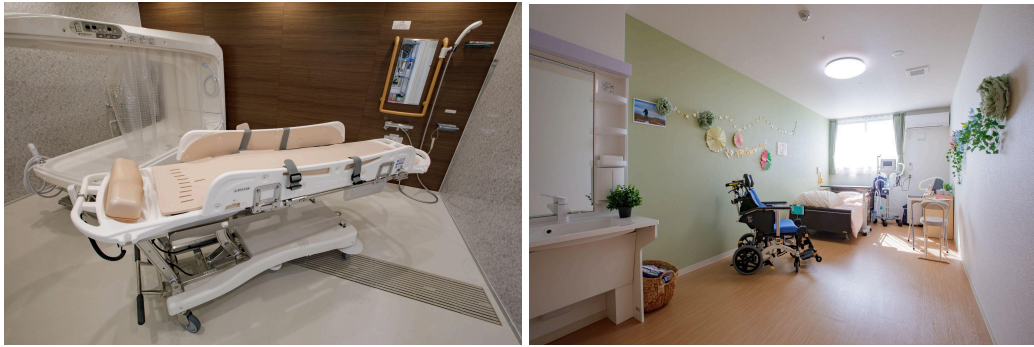
▲介護度に応じた浴槽(左)と居室イメージ(右)