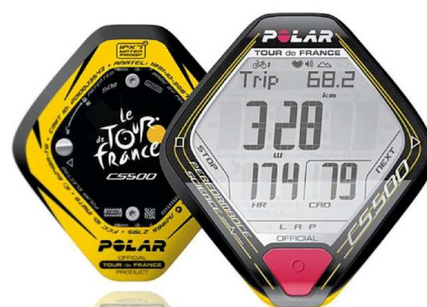
CS500 ツール・ド・フランス 限定モデル オフィシャルサイト http://www.polarcycling.com/ja/