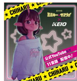
《ラッピング意匠一例》