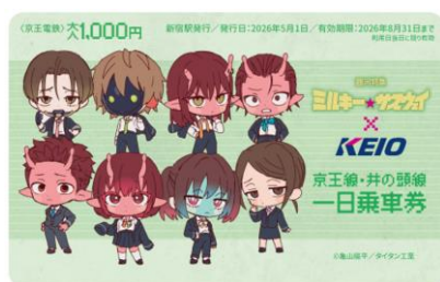
《京王線・井の頭線一日乗車券》