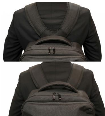
※イメージ画像です

近年、両手を自由にしたいというニーズの高まりや、PCやマイボトルなどの持ち歩きが増えたことで、ビジネスシーンにおいてもリュックを活用するスタイルが主流になりつつあります。一方で、優れた収納力を備えるビジネスリュックは、荷物の重量による肩や腰への負荷が課題となっています。こうした「体への負担を減らしたい」というお客様のニーズに応え、自動車のサスペンション構造をヒントに“バネ原理”を採用した「無重力リュック」を企画しました。