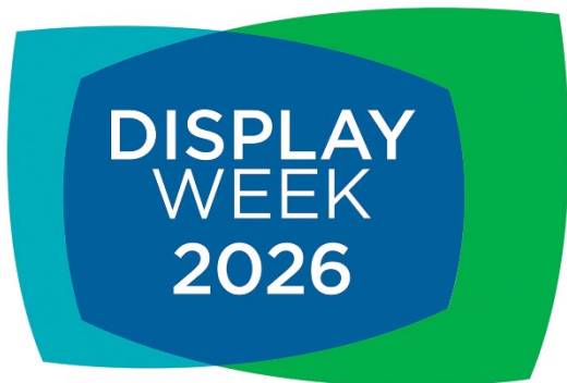
SID Display Week 2026 公式ロゴマーク

デクセリアルズ株式会社（本社：栃木県下野市、代表取締役社長：新家 由久、以下、当社）は、2026年5月5日（火）から5月7日（木）まで、アメリカ・ロサンゼルスで開催されるディスプレイ分野の世界最大の展示会「SID Display Week 2026」に出展（予定）することをお知らせします。