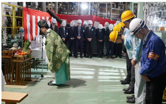
溶融窯の火入れ式の様子