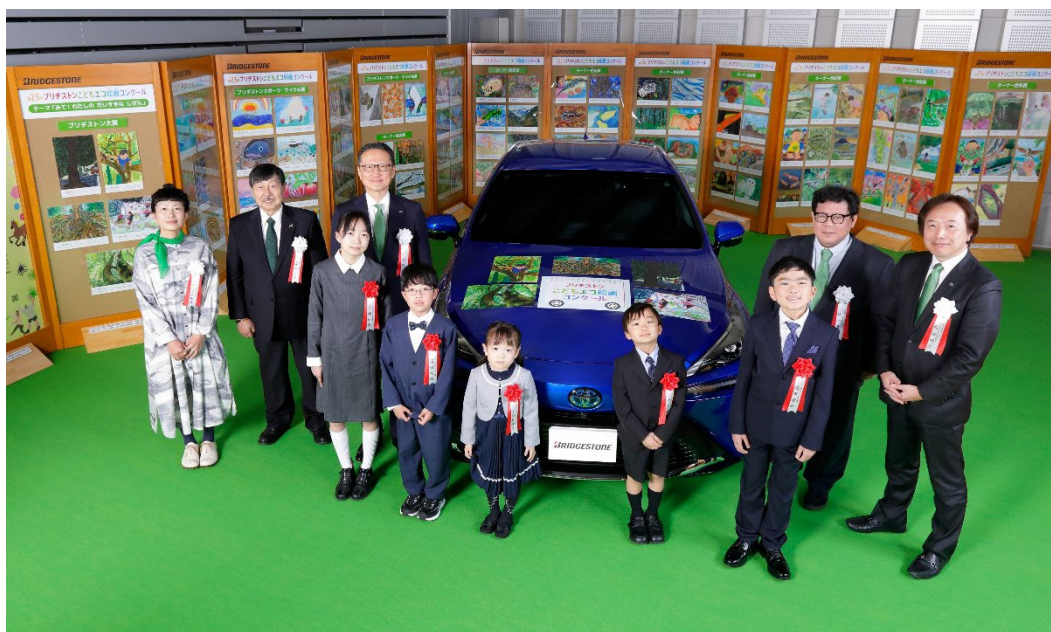
第 23 回ブリヂストンこどもエコ絵画コンクール表彰式 記念写真

今回の作品テーマ「みて！わたしの だいすきな しぜん」にちなみ、全国の小学生や未就学児から 41,862 点の応募が寄せられました。その中から公正かつ厳正な審査の結果、ブリヂストン大賞をはじめとする 100 点の入賞作品を選出し、4 月 3 日（金）に表彰式を行いました。受賞作品は 4 月 7 日（火）から 6 月 16 日（火）までブリヂストン本社のある 東京スクエアガーデン （東京都中央区）にて、また 6 月 18 日（木）から 7 月中旬まで ブリヂストン イノベーション ギャラリー （東京都小平市）にて展示を予定しており、いずれも無料でご覧頂けます。