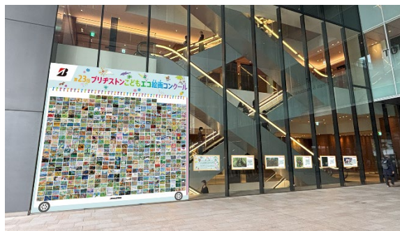
多くの方にご覧いただけるよう、新たに 外通路にも展示を設置（展示イメージ）