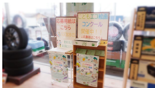
タイヤ交換などの作業の待ち時間にコンクールに 参加できるようにしたタイヤ館横手店（秋田県）

ブリヂストンは、「こどもエコ絵画コンクール」を通じて、多くの人々の環境意識の醸成に貢献するとともに、地域社会と信頼関係を構築し、企業価値向上につなげていきます。