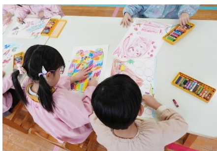
それぞれが感じた自然を伸びやかな表現で描く 保育園の園児たち

ブリヂストンは、当コンクールを全国の小学校へご案内しており、野外観察や調べ学習と絵画制作を組み合わせた授業の一環として活用されることもあります。また、当社グループの一部の販売拠点では、キッズコーナーを設け、タイヤ交換等で来店されたお客様のお子様にもご参加頂きました。さらに、販売店スタッフが法人のお客様を訪問する際に当コンクールを紹介することで、近隣の保育園・幼稚園の先生方や職員、保護者との交流が生まれ、地域の皆さまと協力しながら子どもたちの学びや自然環境への興味を育む機会となっています。