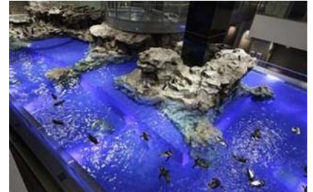
「ペンギンプール」(通常時・6Fから見た様子)