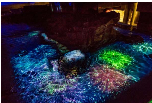
プロジェクションマッピング「ペンギン花火」

『すみだ水族館』（所在地：東京都墨田区、館長：山内 将生）は、今年の夏のメインイベントとして期間限定で開催しているプロジェクションマッピング「ペンギン花火」と企画展「ぬるによろすい」を、ご好評につき2015年9月7日(月)まで期間を延長して開催することを決定しましたので、お知らせします。