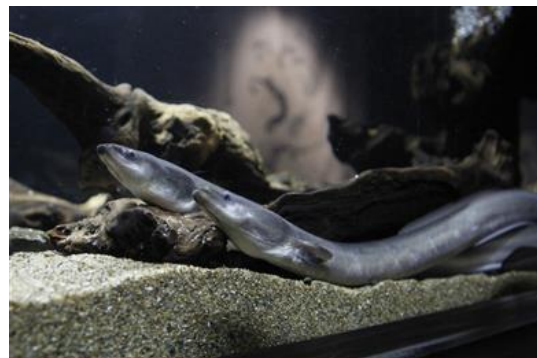
「ぬるによろすい」展示：ニホンウナギ

「ペンギン花火」は、日本最大級*の屋内開放型ペンギンプールの底面全体に、花火をイメージした映像をプロジェクションマッピングを用いて投影するショープログラムです。7月18日（土）の公開以降、カップルやご家族と一緒に楽しめる新しい夏の風物詩として多くのお客さまを魅了し、鮮やかな水中花火と愛らしいペンギンたちの共演は、テレビ、新聞、雑誌などで多数紹介されました。16時以降は、「ペンギン花火」の上映に合わせて、館内に「懐かしい花火大会」をイメージして調合したオリジナルアロマ「花流（かな）」が香り、より一層皆さまに夏の情緒を感じていただくことができます。