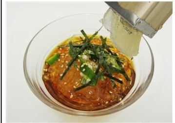
「にゅるっところ天」