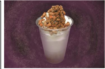
「ぬるぬる納豆シェーク」

販売内容：黒酢にオクラをトッピングしたところ天。その場でところ天突きで押し出して提供します。