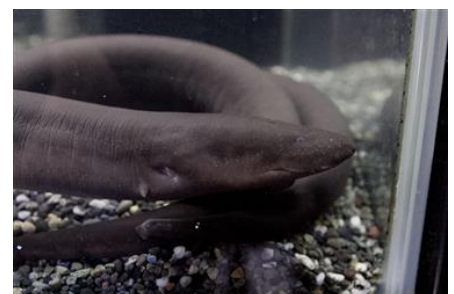
フタユビアンフューマ