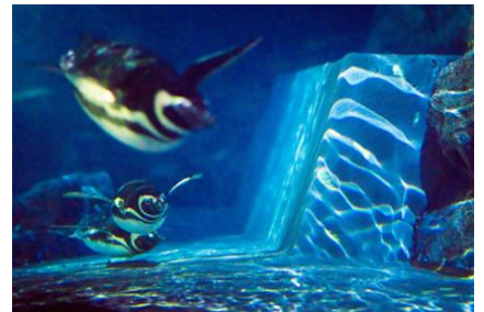
「ペンギン花火」(5Fから見た様子)