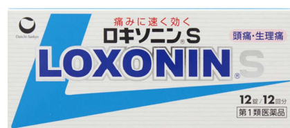
ロキソニンS(鎮痛剤)