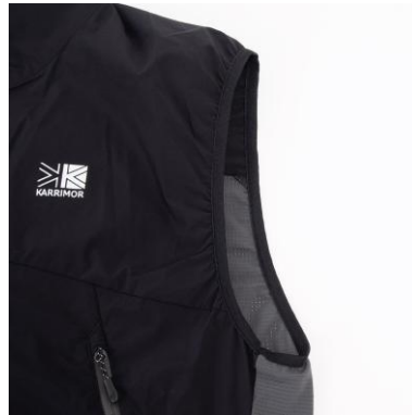
肩口バイディング仕様