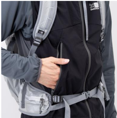
アクセスしやすい フロントポケット