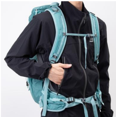
アクセスしやすい フロントポケット