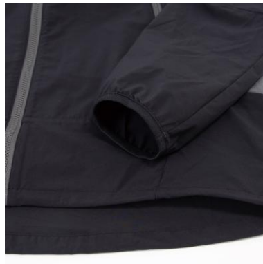
腕まくりしやすい 袖口ニットバインダー仕様