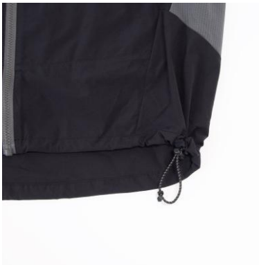
裾口アジャスターコード