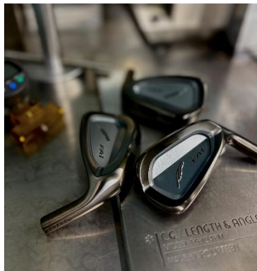
フォーティーン 10 周年限定モデル 10 セット限定