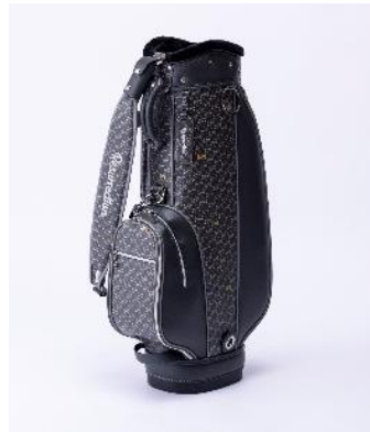
レザレクション 10 周年限定モデル 数量限定