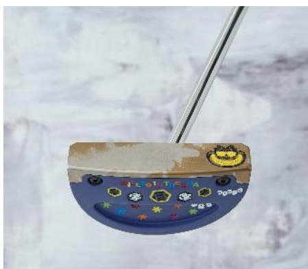
ベティナルディ 10 周年限定モデル 数量限定

世界的に注目を集めるゼロトルクパターなど、ここでしか手に入らない記念商品が揃います。