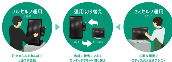
運用切り替えイメージ

一方、お客様が操作に迷った場合や特別な対応が必要な場合は、スタッフが運用モードを切り替えてセミセルフレジとして使用できます。お客様は注文後、支払いだけをタッチパネルの指示に従って行います。