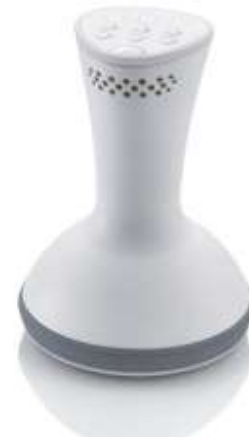
キャビスパ for Pro