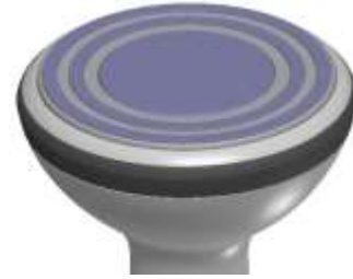
特殊円状フラット電極ヘッド