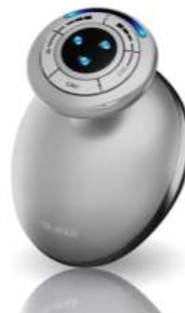
キャビスパ for Salon