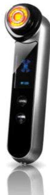
プラチナホワイト RF for Salon