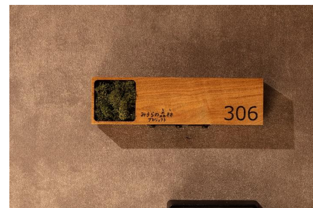
プライムグレーヌ横浜桐畑

※本件に関するニュースリリース https://www.keikyu.co.jp/company/news/2025/20250821HP_25051MK.html