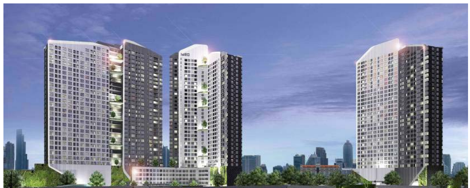
左：Q Chidlom-Petchaburi 上：Ideo 0 2 （右からA棟、B棟、C棟）