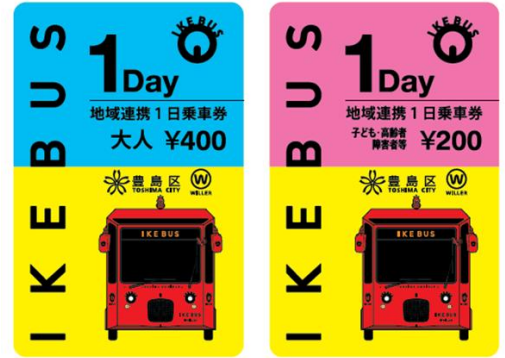
地域連携 1 日乗車券（見本）

※池袋営業所およびバス車内での販売は「通常価格」での販売となりますので、ご注意ください。