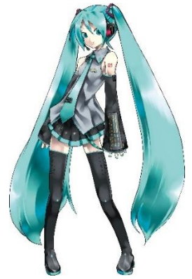
Art by KEI