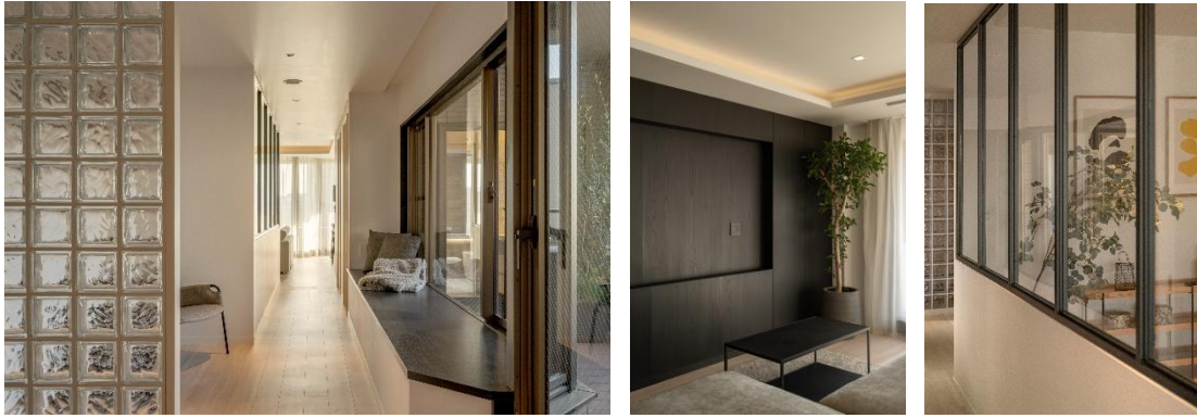
左:玄関ホール／中央:黒浮造りを取り入れた壁面／右:室内窓