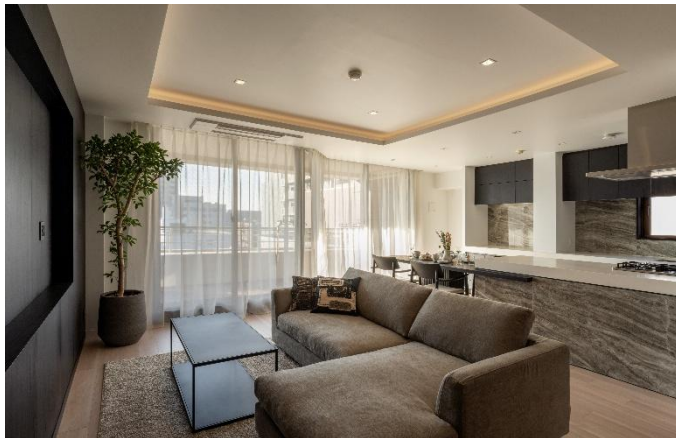
『グランクール河原町二条』 リビング・ダイニング・キッチン

派手さを抑えながらも本質的な上質さと風格を追求した世界観が魅力の MODERN NOBLE EDITION。本住戸では、落ち着いたトーンに重厚感のある黒を差し色とし、木、ガラスなど上質な素材を組み合わせることで、確かな上質さを感じる空間を目指しました。