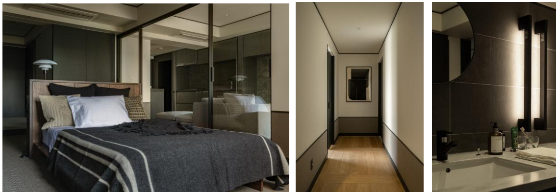
左:主寝室・リビング／中央:パーケット貼りの廊下／右:DRESSING ROOM