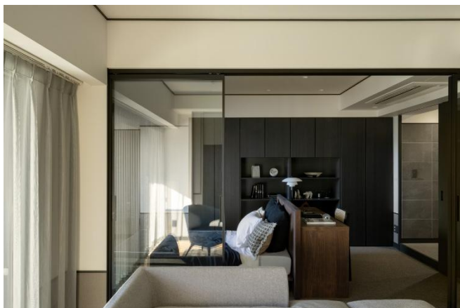
『ザ・アッパーレジデンス・アット・南青山』 ROOM(1)

都市の知性と洗練をまとった世界観が特徴の INTELLIGENCE EDITION。本住戸では、装飾的な遊び心に、視認性の高いラグジュアリー感や現代的な感性を加えることで、都会的な軽やかさと上質さを併せ持つ空間を目指しました。