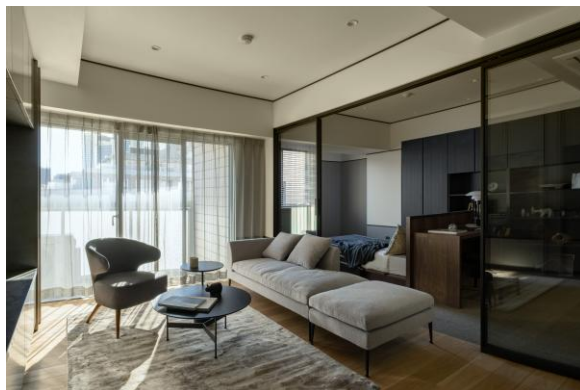
『ザ・アッパーレジデンス・アット・南青山』