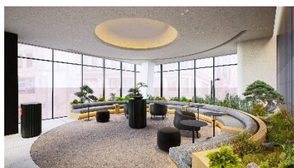
楽 - RAN -

2 階フロアに展開する「glo™ Lounge (グローラウンジ)」は、glo™会員限定で利用できる滞在型ラウンジです。心地よい安心感と新しい体験が融合した空間として設計されており、訪れるたびに glo™のブランド世界観に触れながら、くつろぎの時間を過ごすことができます。