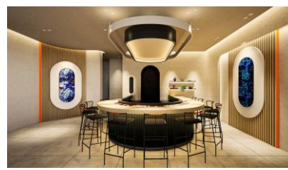
楽 - GAKU -

本ラウンジは、来場者の過ごし方や気分に応じて選べる、3 つのエリアで構成されています。モダンでありながら日本の生活様式を取り入れた国内のホテルや旅館にインスパイアされてデザインされた、各エリアには、それぞれ異なる過ごし方や価値観を象徴する名称とコンセプトが設定されており、守破離の哲学を基に、日本語の「団楽」「念想」「和楽」という言葉に着想を得て名付けられています。人と語らいながら心を通わせるひととき、静かな環境の中で思考を巡らせ自分と向き合うひととき、会話や交流を通じて楽しさを分かち合うひとときなど、来場者の気分や目的に応じた多様なひとときを提供します。