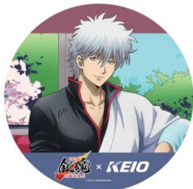
《ヘッドマーク（イメージ）》