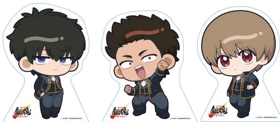
《キャラクターパネルイメージ》