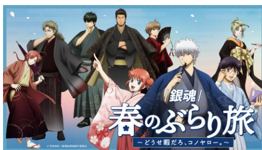
《メインビジュアル》

今後も魅力的なコンテンツと京王電鉄がタイアップすることで、京王グループ沿線施設への誘客ならびに沿線の認知度向上を図ってまいります。