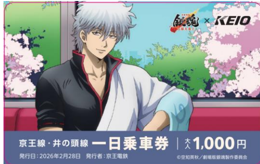
《京王線・井の頭線一日乗車券》