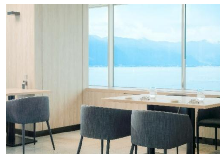
Grill & Dining G イメージ