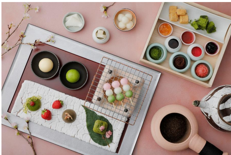
「Hanami Dango Sweets Box」イメージ

場所：レストラン グリル ダイニング ジー 「Grill & Dining G」