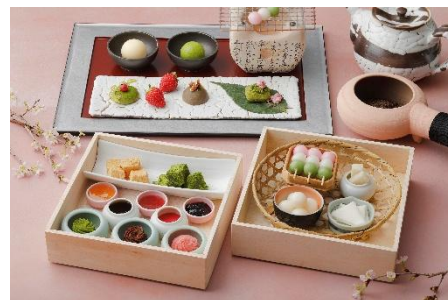
「Hanami Dango Sweets Box」イメージ

煎りほうじ茶 / 煎茶 / 紅茶(Art of Tea)「煎茶と抹茶のベリーミックス」