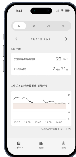
呼吸数の計測結果