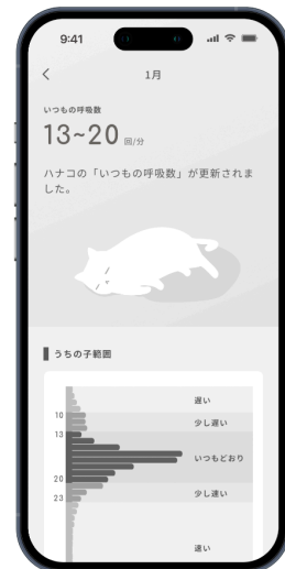
「いつもの呼吸数」算出

LIXILは、今後もイノベーションを取り入れた画期的な商品、サービスを通じ、豊かで快適な住まいの実現に向けて貢献していきます。