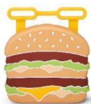
＜期間限定オリジナルリワード＞