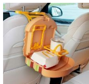
ビッグマック型フードトレイ 車内での使用イメージ

マクドナルドではこれからも、「Myマクドナルド リワード」を通じてお客様に利便性と楽しさを感じていただけるような、オリジナルグッズやコンテンツなどの各種リワードを継続してご用意してまいりますので、ぜひ、ご期待ください。