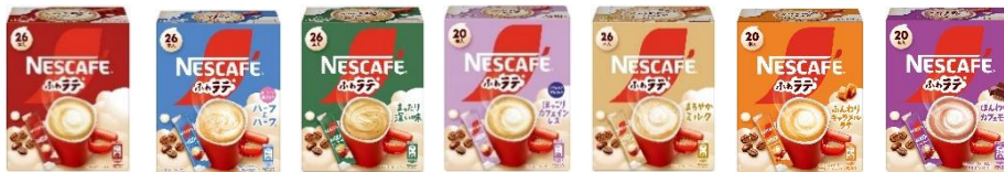
画像(左から): 「ネスカフェ ふわラテ」、「同 ハーフ&ハーフ」、「同 まったり深い味」、「同 ほっこりカフェインレス」、「同 まろやかミルク」、「同 ふんわりキャラメルラテ」、「同 ほんわかカフェモカ」

「ネスカフェ ふわラテ」シリーズは、2013 年の発売以来、家庭やオフィスで手軽にラテを 1 杯ずつ楽しめるスティックタイプの製品として親しまれています。ふわっとした泡とクリーミーな味わいが特長で、ミルク感・コーヒー感・甘さなどで選べる豊富なバラエティでお客様の味わいの好みや多様なニーズに応えます。シルクのようにキメの細かい「泡」を実現するネスレ独自の「シルキークレマ製法」でまろやかな口当たりを実現しています。