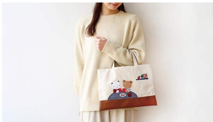
抽選で当たるキャンペーンの賞品例 「ネスカフェ ふわラテ」×「ファミリア」オリジナルバッグ

本コラボレーションは、お子様とご家族の未来のために、ホッとするひとときを届けるとともに、環境に配慮した取り組みを行いたいという両社の想いが重なり、実現しました。「ネスカフェ ふわラテ」のファミリアオリジナルパッケージ製品の発売をはじめ、ファミリアショップでの「ネスカフェ ふわラテ」スティックの試供品としての配布、アップサイクル素材を使用したオリジナルバッグが当たるプレゼントキャンペーン、コーヒー染めの素材を使用した親子で楽しめるワークショップなど、コラボレーションならではの多彩なコンテンツを展開します。