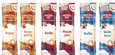
左:「ネスカフェ ふわラテ ファミリア アソートパック 15 本入り」 右: 個包装表面デザイン(全 6 種のメッセージ)