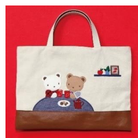
オリジナルバッグ

対象製品 3 個以上お買い上げで、抽選で 300 名様にプレゼントします。「ネスカフェ ふわラテ」×「ファミリア」オリジナルバッグは、「ネスカフェ」の紙製パッケージである「ネスカフェ ゴールドブレンド エコ&システムパック(つめかえパック)」の使用済み空パッケージをはじめとした紙資源や未利用の間伐材から紙糸を制作する一般社団法人アップサイクル(所在地:大阪府大阪市、代表理事 森原 洋)のプロジェクト「TSUMUGI」から生まれたアイテムです。