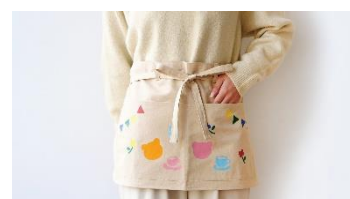
オリジナルエプロンのイメージ

予約開始: 2026年2月28日(土) 9:00～ 対象: 4歳～小学生のお子様とその保護者 ※リクエストに応じ、大人用サイズのエプロンも用意できます。 参加費(税込): 3,300円