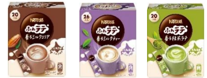
画像(左から): 「ネスレ ふわラテ 香るミルクココア」、「同 香るミルクティー」、「同 香る抹茶ラテ」

「ネスカフェ ふわラテ」ブランド情報: https://nestle.jp/home/brands/nestle/lineup/fuwa-latte