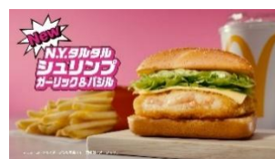
♪ ガーリック&バジル