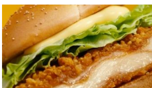
♪ ジューシー チキン