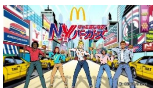
♪ マクドナルドの N.Y. バーガーズ