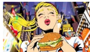
NA： 行った気になる N.Y. バーガーズ