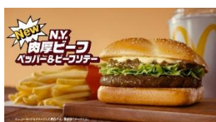
♪ ペッパー& ビーフソテー