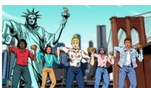
♪ N.Y. バーガーズ