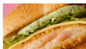
♪ タルタル シュリンプ