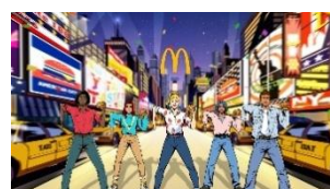
♪ タラッタッタター