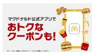
NA： お得なクーポンも