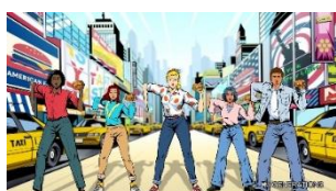
♪ N.Y. バーガーズ