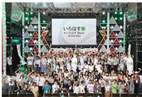
<表彰式での集合写真>

「いろはす Meet」はパシフィコ横浜の臨港パークで開催され、参加者はおもいおもいの方で、水の美しく斬新な一面を捉えた「LOVE WATER PHOTO」を撮影しました。作品は共通のハッシュタグ「#いろはす Meet」「#LoveWater」をつけて投稿されており、「Instagram」上でもご覧いただけます。撮影イベント後はテレビ朝日・六本木ヒルズで開催中の「SUMMER STATION」にて表彰式が開催され、投稿作品のなかから「いろはす賞」などが選ばれました。