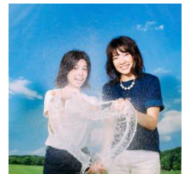
※ブースでは上記の様な画像を撮影できます。