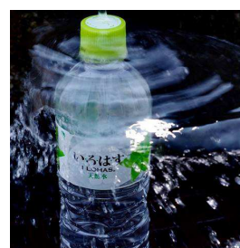
<その他の受賞作品>

発売から6年目となる2015年、「いろはす」は水そのものの価値を伝えることに主軸をおいた新しいコミュニケーションを展開しています。本イベントもその一環として水の日である8月1日に開催し、天然水ブランド「いろはす」ならではの斬新な表現方法で、新たな水の側面や魅力や楽しさをこのイベントを通して多くの方にご体験いただくことができました。「いろはす Meet」の開催は、「いろはす」ブランドとして、初めての取り組みとなります。