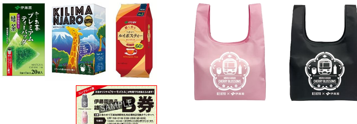
伊藤園商品詰合せ（イメージ）