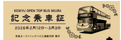
硬券型記念乗車証（イメージ）