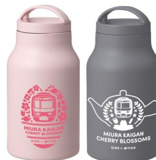
サーモボトル（イメージ）