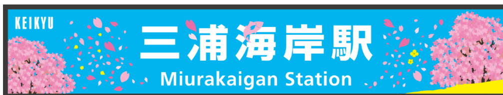
デザイン変更する駅名看板（イメージ）