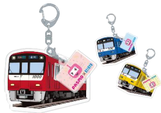
オリジナルキーホルダー （イメージ）

※オリジナルキーホルダーは、3 種類からお選びいただけますが、在庫状況により一部の種類をお選びいただけない場合がございます。あらかじめご了承ください。