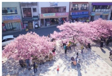
満開の三浦海岸河津桜（イメージ）