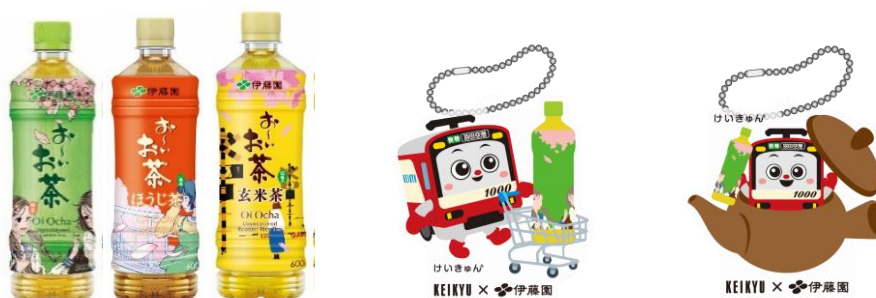
伊藤園お〜いお茶桜エールパッケージセット (イメージ)