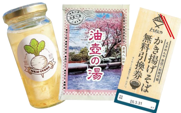
大根梅ゆずピクルス