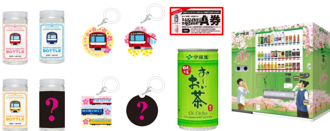
KEIKYU SAKURA BOTTLE （イメージ）