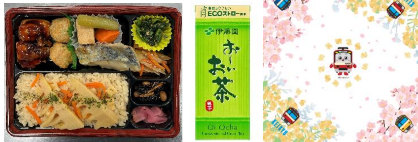
～春の旬彩～ 幕の内弁当 (イメージ)